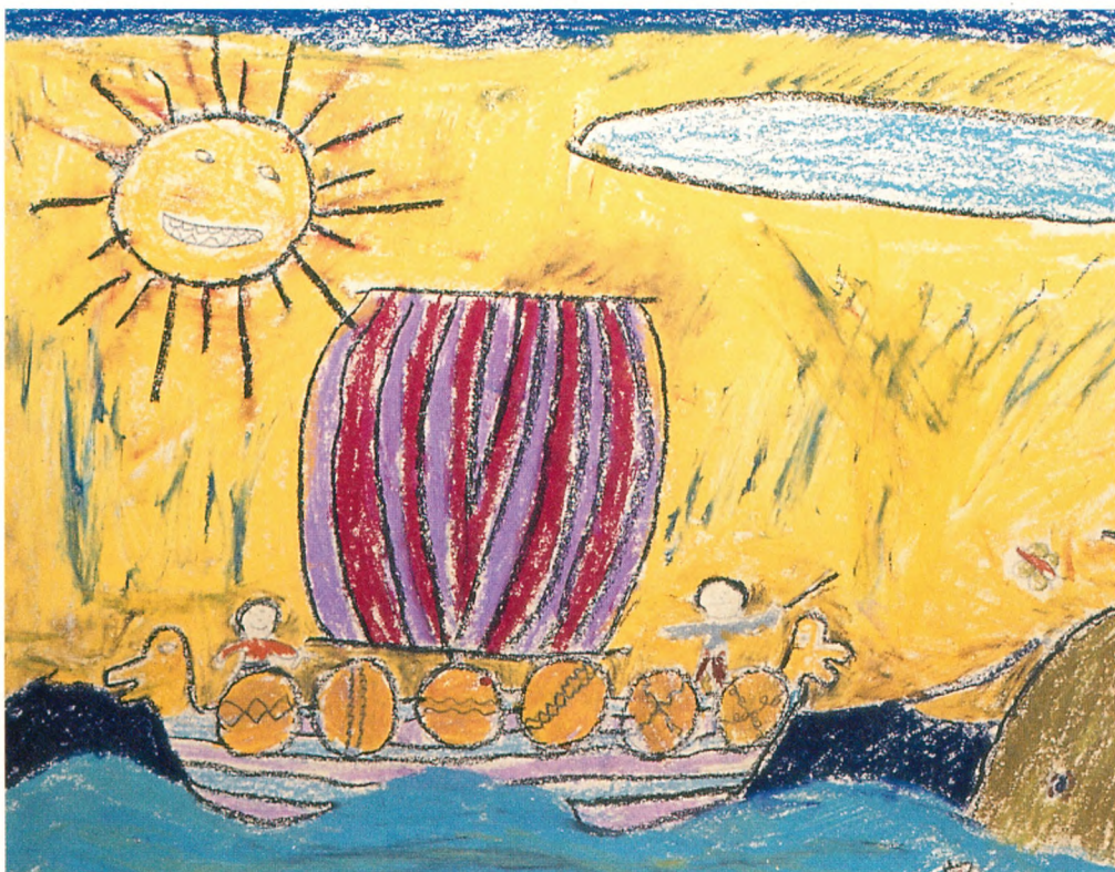
2. kl. har talt om Svend Tveskæg og vikingetiden. "Den danske flåde står ud".

Stk. 3. Som led i deres æstetiske udvikling og som medskabere af kultur udvikler eleverne fortrolighed med kunstens og massekulturens billedformer, og de forstår betydningen heraf i egen og i fremmede kulturer.