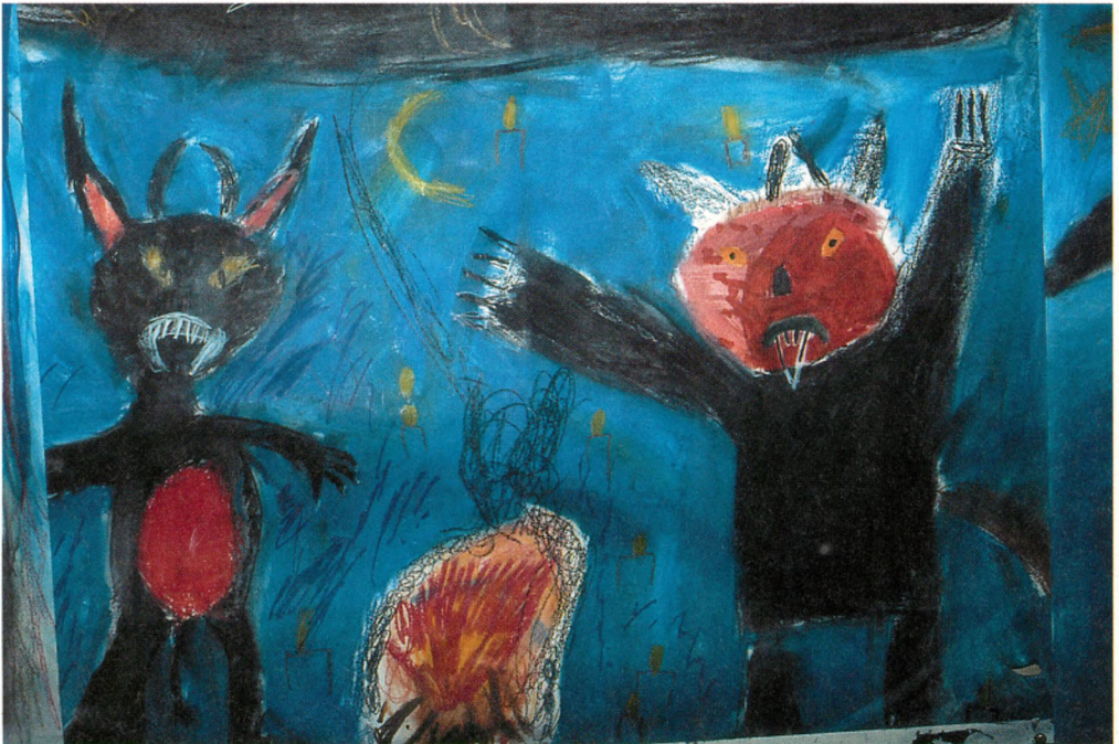
1. klasse har arbejdet med at dramatisere emnet »Trolde« til musik.

Der er forskellige tilgange til billedarbejdet. Når eleverne sanser og bruger deres opmærksomhed målrettet, kom-