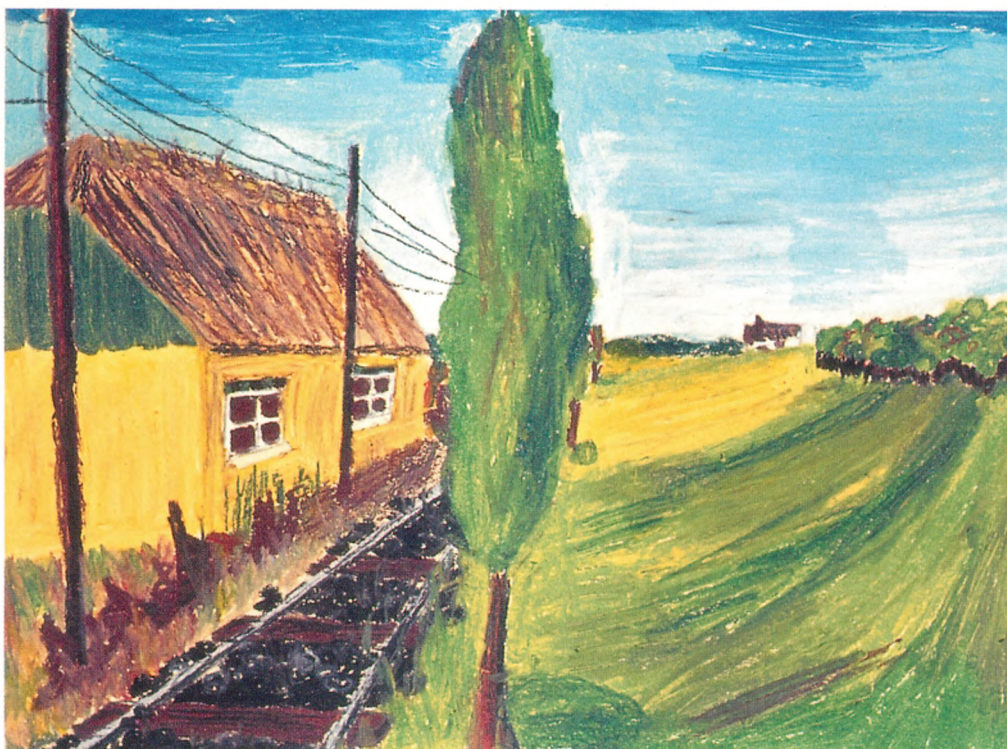
8. kl. har arbejdet med perspektivtegning. "Langs jernbanen".

nødvendigt, for at de kan opleve betydningen af deres arbejde. Der bør derfor anvendes materialer og værktøj af god kvalitet, der er med til at signalere det seriøse, og at elevernes arbejde tages alvorligt. Det er naturligt, at eleverne stifter bekendtskab med farvelære, stofflige og strukturgivende materialer, og hvordan der kan skabes rum i billeder både ved hjælp af farver og perspektiviske linievirkninger. Det kræver viden og forståelse. Voksenkunsten inddrages som demonstrationsmateriale, og er med til at udvikle den æstetiske dannelse og elevens forhold til eget udtryk. Derudover viser et