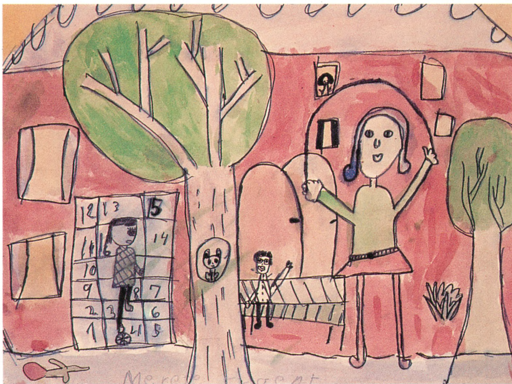
3. klasse har arbejdet med emnet »Det jeg allerhelst vil lave, når jeg er i skole«.

kefremstilling. Første klasse er i gang med et arbejde om sig selv. Eleverne får et stort stykke pap. Med tørre farver skitseres ansigtet. Øjnenes udseende og placering studeres i et spejl. Dukken får hår af garn og iklædes tøj. Foran et spejl indøver eleven dukkens bevægelser. Hvordan bevæger jeg den, når den er glad, sur, indsmigrende uden tale? Hvordan er dukkens stemmeføring i samme situationer? Eleverne går sammen og skaber små spontane spil. Arbejdet udvikler elevernes evne til at sætte sig i andres sted og kan udfordre mange elevers vovemod, fordi de kan 'gemme' sig bag dukken.