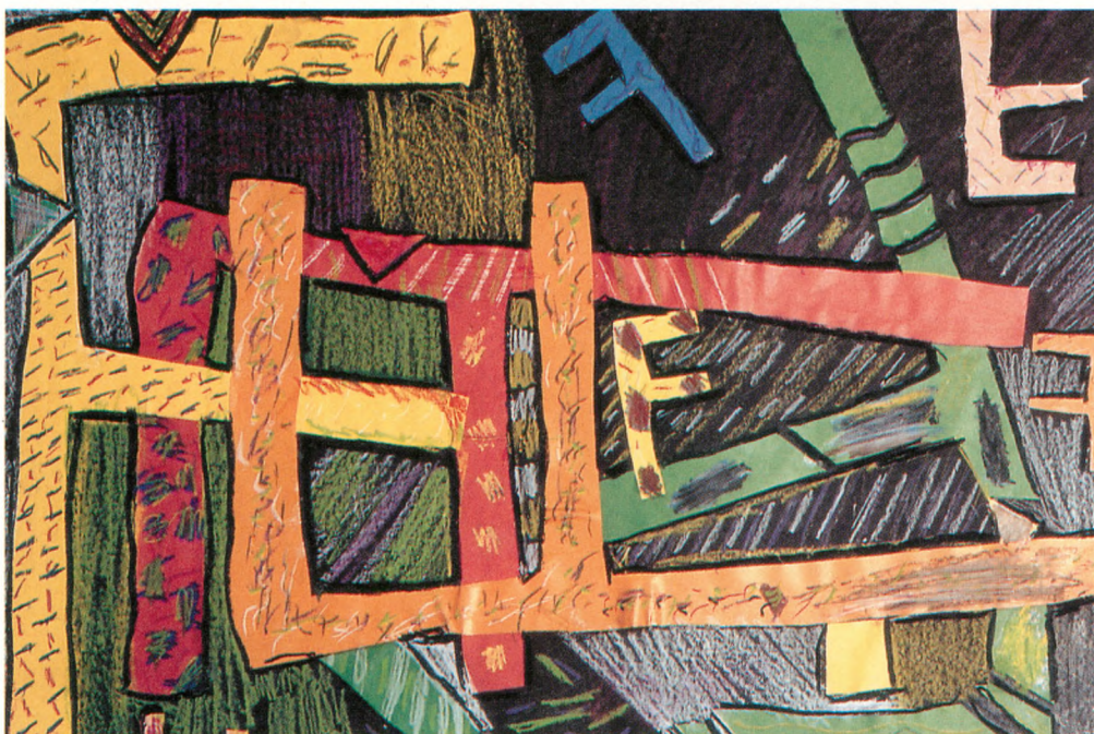
5. klasse har arbejdet abstrakt. Eleven har valgt et F og brugt det i en komposition.

mer de i kontakt med vidt forskellige oplevelsesområder. Det har betydning for billedernes indhold og form.