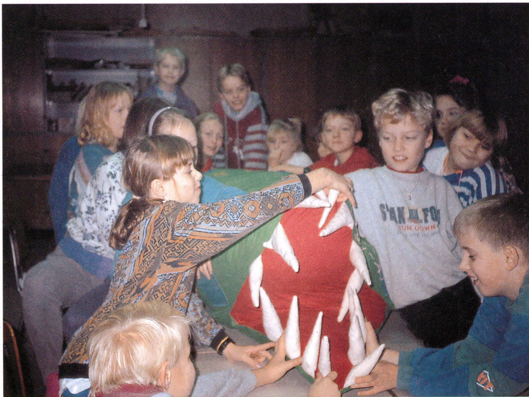
Egtved Skole: Et stort dyr.

Eleverne vil i fællesskab fremstille et stort, 2-3 meter langt, rumligt dyr – en krokodille, gravhund, skildpadde eller fantasidyr til at sidde på eller lege med i klassen. Komposition og far-